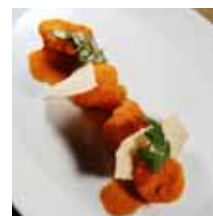
Nokkelaa. Skoonelainen sinihomejuusto porkkanapulveroituna.